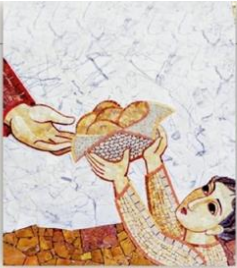
"La Multiplicación de los panes" Marko Rupnik

"Te alabo Padre ... porque así lo has querido" (Mt 11, 25a. 26a).